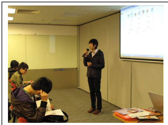
畢業生分享學習經歷。