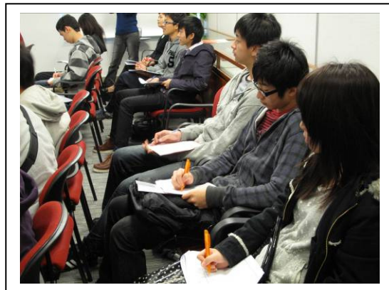
學生學習會計概念。